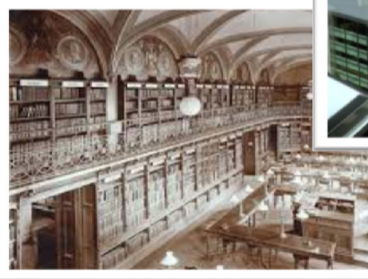
دانشگاه نسل دوم