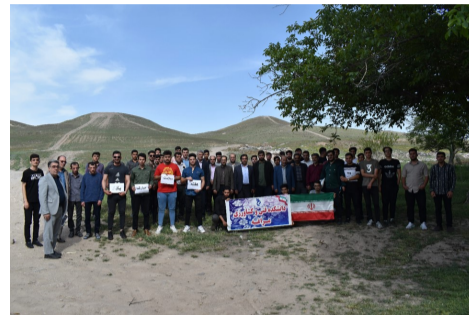
کوهپیمایی و پیاده روی به مناسبت هفته سلامت