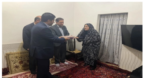
تجلیل از خانواده شهدا