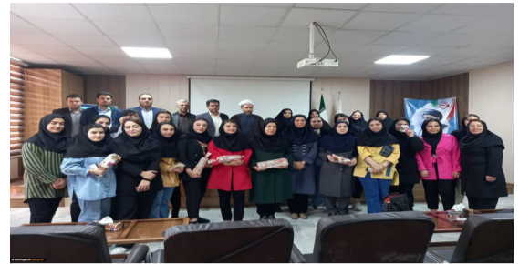
گرامیداشت ولادت حضرت معصومه (روز دختر)