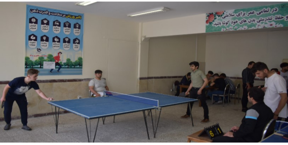
برگزاری مسابقات ورزشی ویژه دانشجویان