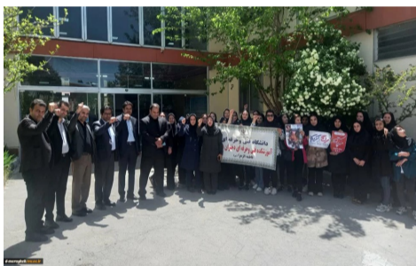
مظلوم غزه و تظاهرات ضد صهیونیستی در آمریکا