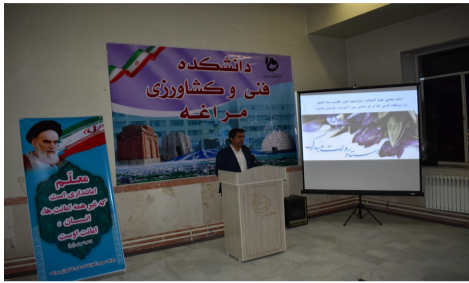
مراسم بزرگداشت روز معلم