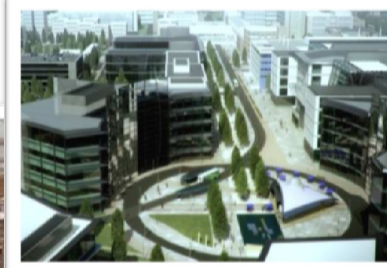
دانشگاه نسل سوم

دانشگاه های نسل اول: این دانشگاه‌ها آموزش محور بودند و فعالیت‌های آموزشی با هدف توسعه انسانی انجام می‌شود. به طور کلی در دانشگاه نسل اول، آموزش ابزاری برای شناسایی مسائل اجتماعی، فرهنگی، اقتصادی جامعه و ارائه راه‌کارهای مربوط است.