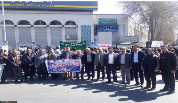
حضور پرشور دانشگاهیان در راهپیمایی عظیم روز جهانی قدس