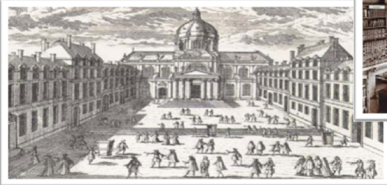
دانشگاه نسل اول