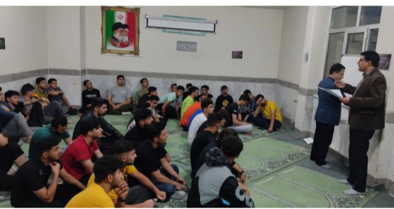
برگزاری دوره های مختلف در هفته سراهای دانشجویی